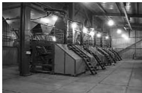
Рис. 3. Подпись к рисунку

Текст статьи, текст статьи, текст статьи, текст статьи, текст статьи, текст статьи, текст статьи, текст статьи, текст статьи, текст статьи, текст статьи, текст статьи, текст статьи, текст статьи.