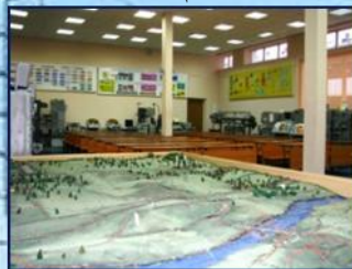
Класс тактики РТВ

разработки новых учебных программ, планов и учебно-методической литературы, введения новых учебных дисциплин, создания новых учебных аудиторий и лабораторий. Большой войсковой и педагогический опыт, высокая организованность и ответственность за порученное дело, самоотверженный и плодотворный труд позволили коллективу в кратчайшие сроки с честью справиться с этими сложнейшими задачами. В результате, не ожидая офици-