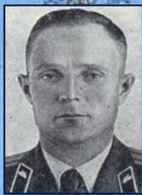
Герой Советского Союза полковник Назаренко А.К.