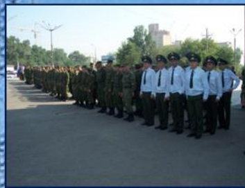
Подведение итогов войсковой стажировки