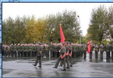
Торжественное вручение копии Боевого знамени Красноярского ВКУРЭ ПВО

для Радиотехнических войск ВВС, преемственности и умножения офицерами, курсантами и студентами славных традиций Красноярского ВКУРЭ ПВО, твердой уверенности ветеранов училища, что ответственное дело подготовки высококвалифицированных кадров находится в надежных руках. В её основе лежит высокий профессионализм, принципиальность и требовательность профессорско-преподавательского состава Института военного обучения СФУ, ядро которого составляют преподаватели, командиры и выпускники Красноярского ВКУРЭ ПВО. Много сил и энергии они отдают тому, чтобы за время обучения курсанты и студенты Института военного обучения получили