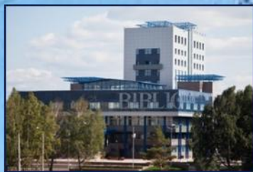
Библиотека и административное здание

Сегодня мы отмечаем знаменательный юбилей – 55-летие системы военного обучения в Сибирском федеральном университете, по праву считающимся одним из крупнейших и лучших ВУЗов страны.