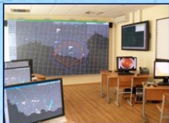
Учебный командный пункт