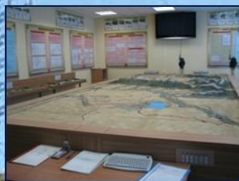
Класс общей тактики