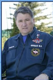
Герой Российской Федерации генерал-полковник Воробьев Юрий Леонидович

Заместитель Председателя Совета Федерации, действительный государственный советник Российской Федерации 1-го класса