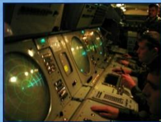
На занятиях по технической подготовке

ального решения о создании учебного военного центра, преподавательский состав уже с 2006 года в соответствии с государственными контрактами приступил к подготовке будущих кадровых офицеров – 110 инженеров по эксплуатации радиолокационных