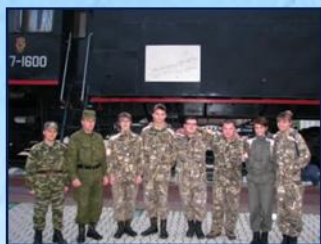
Поисковый отряд «Енисей»

созданы школа бальных танцев и вокально-инструментальный ансамбль «Сибирские курсанты», которые активно участвуют в различных культурных мероприятиях.