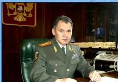
Герой Российской Федерации генерал армии Шойгу Сергей Кужугетович