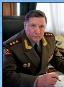
Генерал-полковник Чиркин В.В.