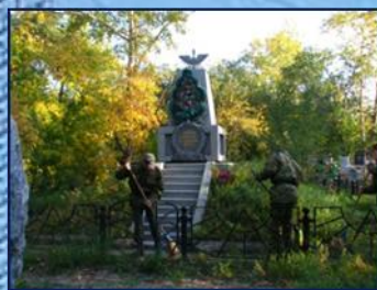
Работа на мемориале павших воинов

Великой Отечественной войны, редакция газеты «Аргументы и Факты на Енисее» признала коллектив Института военного обучения лучшей общественной организацией Красноярского края и наградила его памятной гильзой со священной землей с Мамаева Кургана.