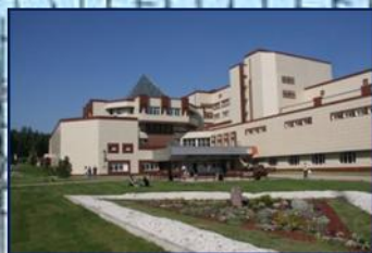
Институт архитектуры и дизайна

Ведущая свою историю с создания военных кафедр Красноярского государственного политехнического института и Красноярского государственного университета цветных металлов и золота, вошедших в состав СФУ, система военного обучения университета за короткий период времени прошла бурный и славный путь развития. Этот путь неразрывно связан с ростом могущества нашего государства и его Вооруженных сил, закономерностями научно-технического прогресса, развития средств воздушного, воздушно-космического и наземного нападения. Важной особенностью военного обучения в вузе на всех этапах его развития являются единство теории и практики, непрерывный рост научно-педагогического потенциала и учебно-материальной базы, военно-научной и педагогической культуры, требований к качеству подготовки выпускников. Благодаря высокому уровню военной подготовки и фундаментальным знаниям, полученным в базовых институтах университета, наши выпускники пользуются заслуженным авторитетом и уважением в войсках.