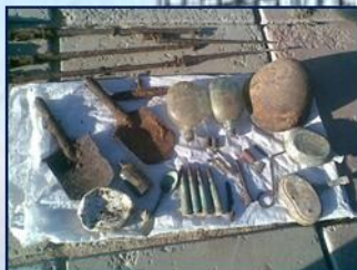
С мест боев

В 2011 и 2012 годах группы преподавателей и курсантов приняли активное участие в поисковых работах на местах боев Великой Отечественной войны в Волгоградской и Смоленской областях. В ходе работ ими были подняты останки 31 красноармейца и установлена личность двух из них. С мест боевых сражений отрядами привезено много экспонатов, которые были переданы в музей института.