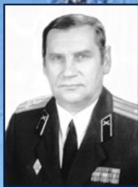
Полковник Платов П.И.