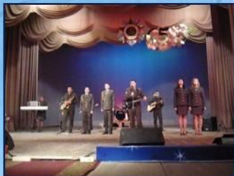
ВИА «Сибирские курсанты»

назии №13 по военно-патриотическому воспитанию, физике, математике, китайскому языку и авиамоделизму. Наши курсанты и студенты активно участвуют в организационном сопровождении мероприятий г. Красноярска и Октябрьского района, Культурно-образовательного центра, в проведении Дня открытых дверей Сибирского федерального университета. В Институте военного обучения