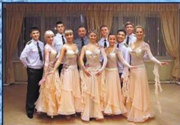
Школа бальных танцев

созданы школа бальных танцев и вокально-инструментальный ансамбль «Сибирские курсанты», которые активно участвуют в различных культурных мероприятиях.