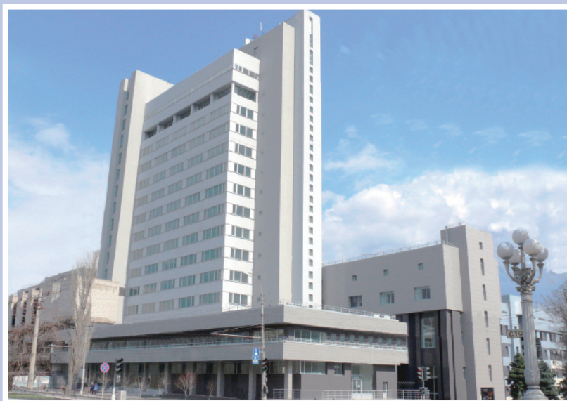
Волгоградский государственный технический университет