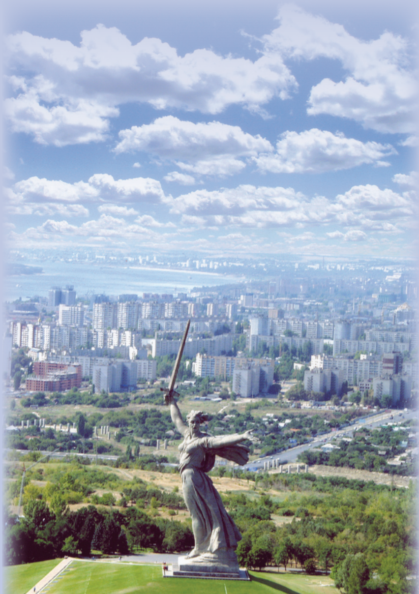
Историко-мемориальный комплекс «Героям Сталинградской битвы на Мамаевом кургане»