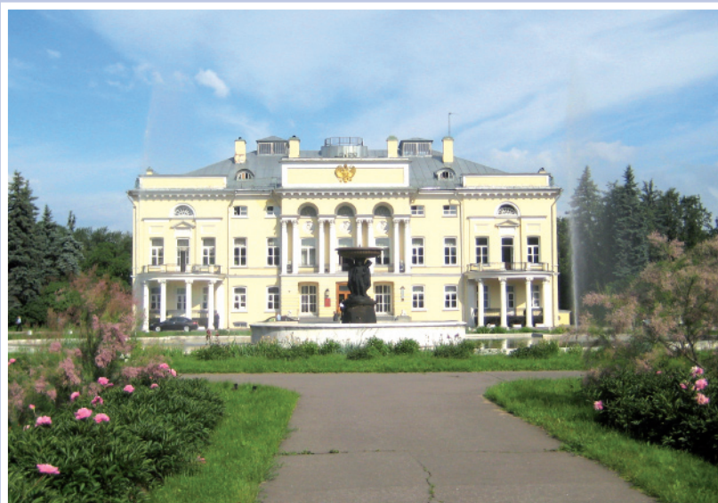
Александрйский (Нескучный) дворец – здание Президиума Российской академии наук