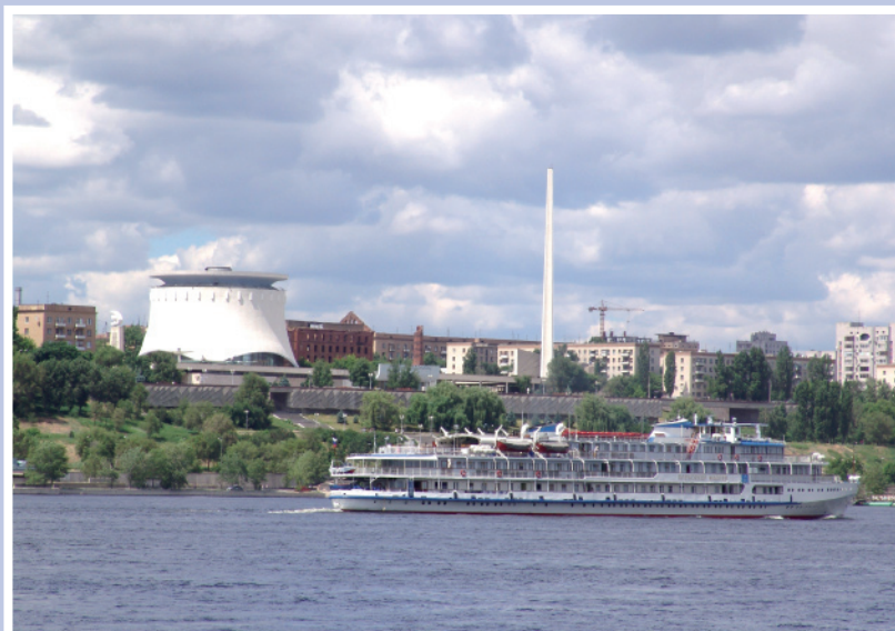
Центральная часть Волгограда. Вид с реки Волги